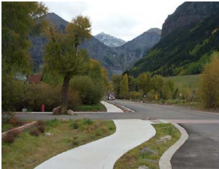
Región 5 Mejoramiento del transporte en las aceras de Telluride para un organismo local

“El propósito de este título es establecer una política uniforme para dar un trato justo e igualitario a aquellas personas desplazadas como resultado de programas federales o con subvención federal, con el fin de que dichas personas no padezcan perjuicios excesivos como resultado de los programas diseñados para beneficiar al público en general”.