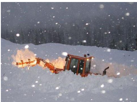
Región 5 U.S. Hwy. 160 oeste de Wolf Creek Pass

Chief Engineer CDOT (Ingeniero en jefe del CDOT) 4201 East Arkansas Avenue Denver, Colorado 80222