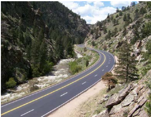
Región 1 U.S. Hwy. 6 Clear Creek Cañón: atenuación de deslizamiento de rocas

Por favor, no firme un contrato de venta o un acuerdo de alquiler de un hogar nuevo hasta que su agente de reubicación lo haya inspeccionado y se haya asegurado de que cumple con las normas DSH.