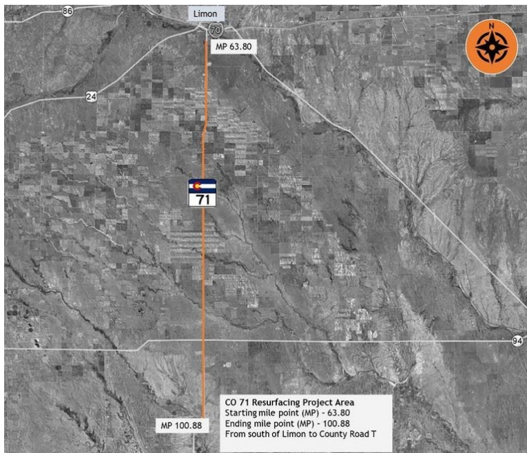
Proyecto de repavimentación de la carretera CO 71 en el condado de Lincoln