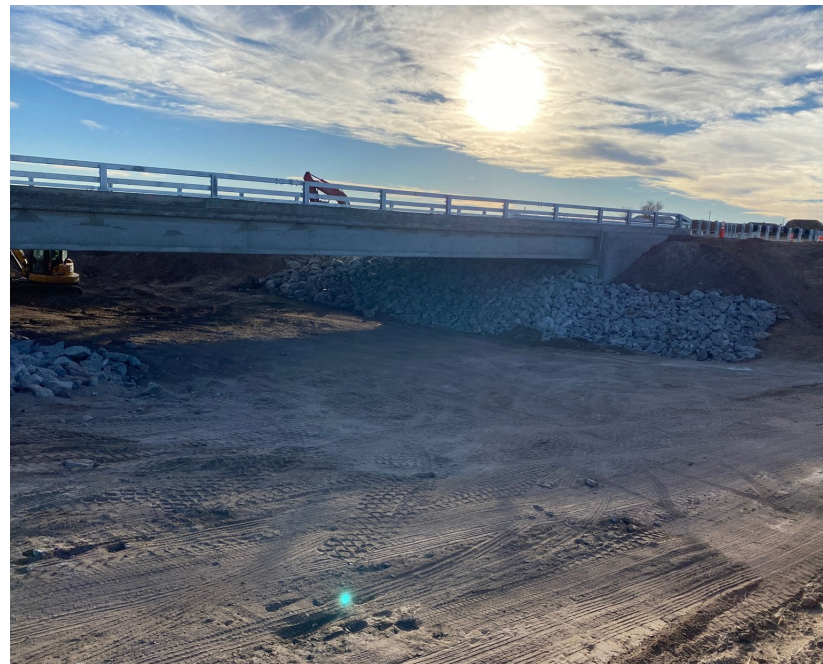
Sustitución del puente CO 61 al norte de Otis