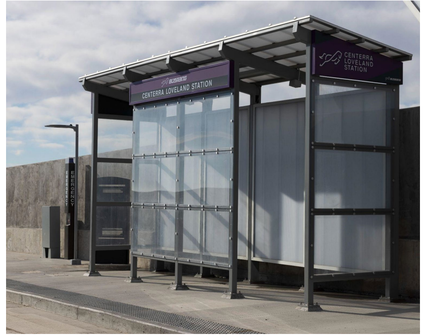
Centro de Movilidad I-25 Norte I-25 construir; Centro de Movilidad Centerra Loveland