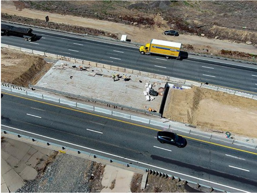
Carriles Express de la I-25 Norte: Tramos 6, 7 y 8. Incluyendo New Bridge Deck Valley Road, Berthoud.