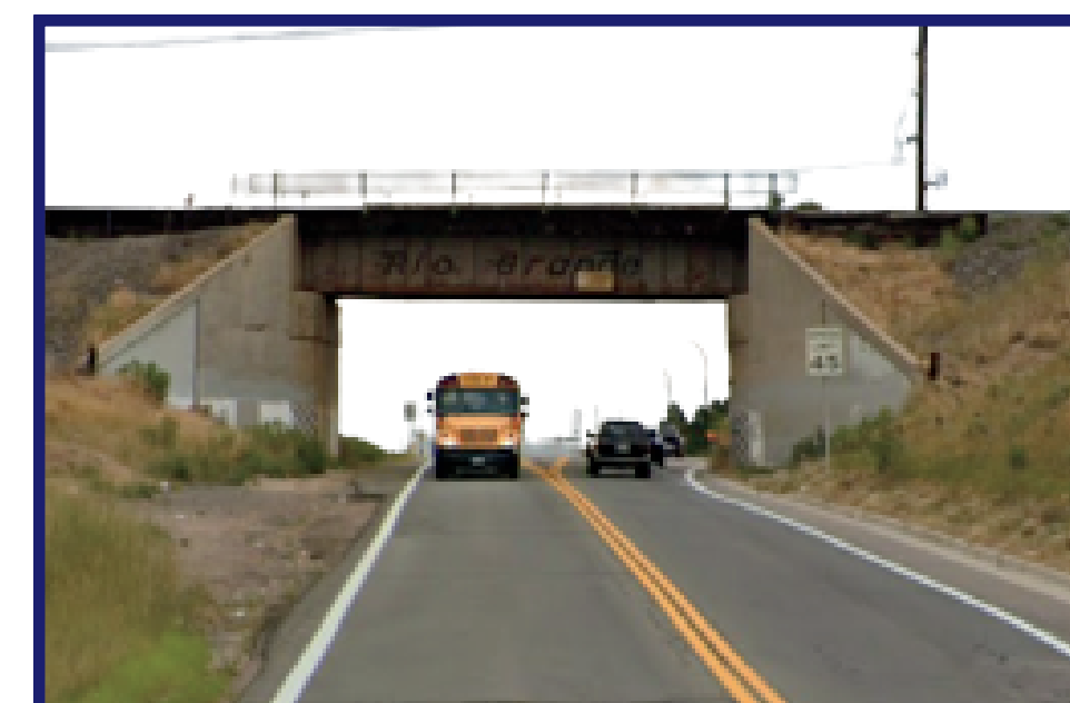
Railroad over road Via de tren sobre carretera