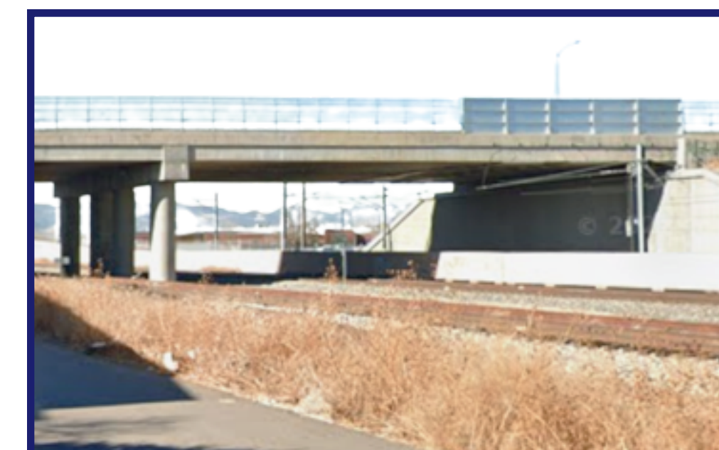
Highway over railroad Carretera sobre via de tren