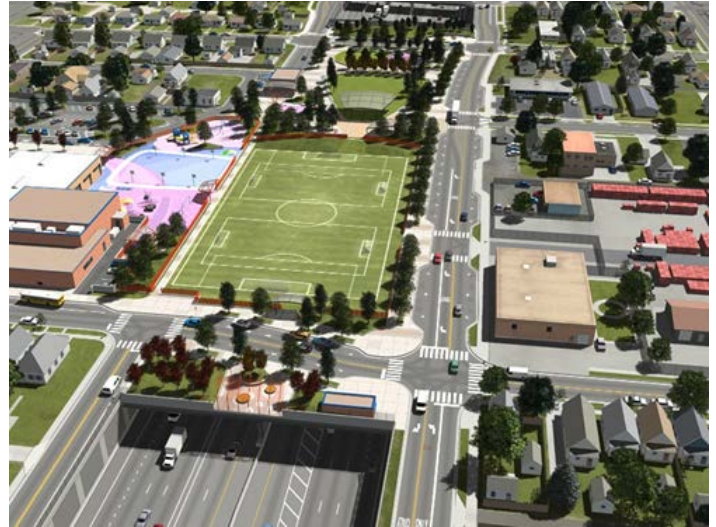
Representación visual del nuevo parque sobre la I-70