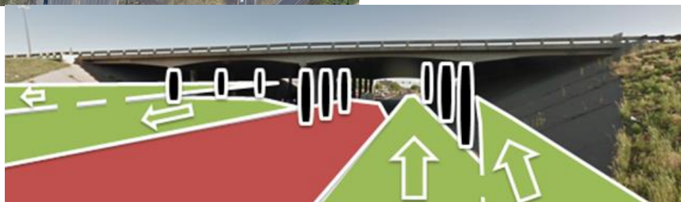
Vista de la calle: Configuración de tráfico temporal anticipada

Tenga en cuenta que todos los carriles permanecerán abiertos durante las horas punta de viaje de 5 a 8:30 a.m. y de 3:30 a 7 p.m. El acceso peatonal se mantendrá y cambiará de manera intermitente desde el lado este y oeste a medida que trabaja.