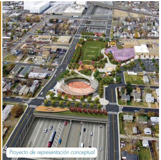
Proyecto de representación conceptual

También se encuentra en marcha la selección de un socio privado para la construcción del Proyecto de la I-70 Este. Cuatro equipos de empresas desarrolladoras han sido seleccionadas para responder a la Solicitud de Propuesta (RFP abreviación en inglés). La empresa desarrolladora seleccionada diseñará, construirá y ayudará a financiar la I-70 Este, así como también operará y mantendrá el proyecto una vez terminado. La selección final de una empresa socia desarrolladora está programada para la primavera del 2017.