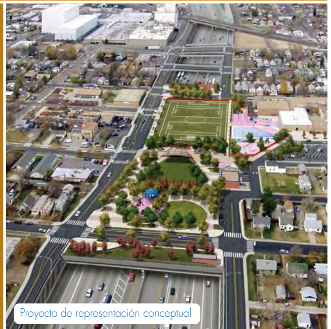
Proyecto de representación conceptual

También se encuentra en marcha la selección de un socio privado para la construcción del proyecto. Cuatro equipos de empresas desarrolladoras han sido seleccionadas para responder a la Solicitud de Propuesta (RFP abreviación en inglés). La empresa desarrolladora seleccionada diseñará, construirá y ayudará a financiar la I-70 Este, así como también operará y mantendrá el proyecto una vez terminado. La selección final de una empresa socia desarrolladora está programada para el verano del 2017.