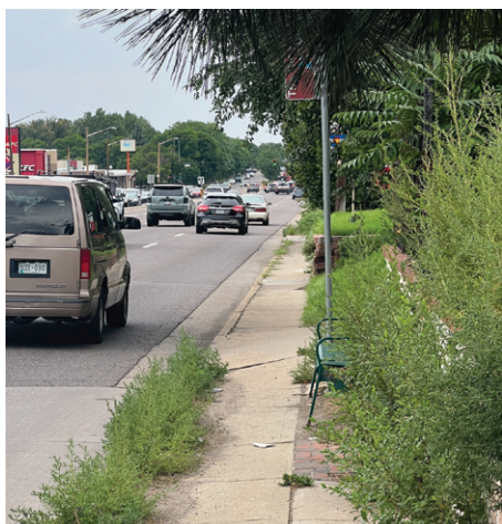
Colorado y 26th Ave.