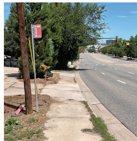
Colorado y Dartmouth

Escanear para ingresar a la página web del proyecto