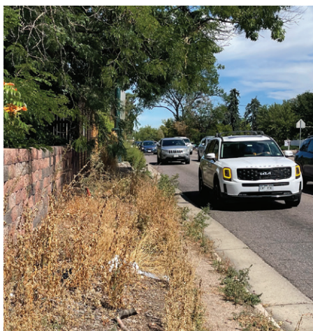
Colorado y 3rd Ave.